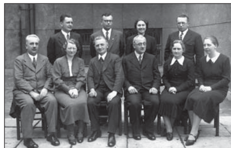
Učitelský sbor Městské školy v Hulvákách v roce 1938

30. dubna 1945 byla Ostrava osvobozena a ve školství nastaly velké změny. Opětovně rozdělená na Dívčí a Chlapeckou. Obecná škola byla