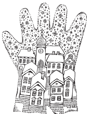
Kresba: Jindřich Oleš

Únor je podle gregoriánského kalendáře druhý měsíc v roce, zatímco v římském kalendáři byl posledním měsícem v roce. Únor má 28 dní, v přestupném roce má 29 dní. Obecně lze říci, že přestupný rok je problémem kalendářů (juliánský, gregoriánský), které se snaží běh času počítat podle cyklů navzájem nedělitelných (den, měsíc, rok). Třikrát v historii měl únor i 30 dní: v 13. století učenec Jan z Hollywoodu tvrdil, že v juliánském kalendáři měl únor 30 dní v přechodných rocích, a to od 44 př. n. l. do 8 př. n. l., kdy Octavianus Augustus zkrátil únor, aby dal měsíci srpen (Augus) pojmenovanému po něm, stejnou délku jakou měl červenec (který byl mimo jiné pojmenován po jeho předchůdci Juliu Caesarovi). Pro toto tvrzení neexistuje žádný jiný historický důkaz a pravděpodobně jde o mýtus. 30 dní zaznamenali ješ-