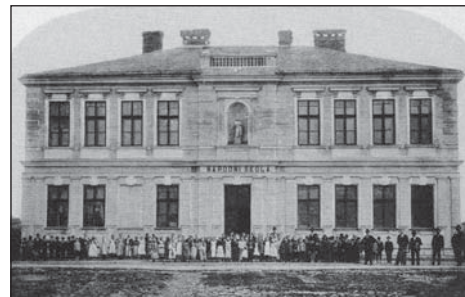
Národní škola v Hulvákách v roce 1900

V roce 1953 došlo k poslední velké změně. Všechny školy byly sloučeny do jedné a po přidání 9. ročníku v roce 1959 znel název školy Základní devítiletá škola v Hulvákách. Název se opět změnil v roce 1981 po zrušení 9. ročníku na Základní školu v Hulvákách. Od roku 1982 až do roku 1989